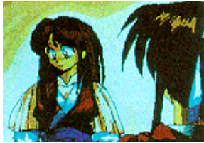
나방의 진짜 이름은 나방방이었다.

다리를 건너기 전에 서있는 스님과 이야기하면 이미 마교가 중원 각처에 근거지를 마련하고 전국을 삼키려 한다는 사실을 알 수 있다. 다리를 건너 왼쪽으로 가면 나방이 있는 것을 볼 수 있다. 나방과 이야기하면 남궁세가장에 진기한 보물인 금구슬이 있다고 한다. 또 금구슬을 사용하면 금속의 세기를 배로 높여주며, 해남도의 현철석과 같이 섞으면 강력한 무기를 만들 수 있다고 말하면서 남궁세가로 같이 가자고 한다. 나방과 같이 남궁세가로 간다. 남궁세가로 가 금구슬을 찾는 도중 함정에 빠져 감옥에 갇힌다. 감옥에 갇혀있으면 어디선가 향기로운 냄새가 난다. 나방과 이야기하면 나방은 머리를 풀어 자신이 여자임을 알려주는 동시에 자신의 이름은 나방이 아니고 나방방이라고 한다. 이때 갑자기 건달파왕이 나타나 나방방을 데려간다. 건달파왕이 아래의 감옥에 가두고 떠나면 빠져나갈 곳이 아무데도 없는 것처럼 보인다. 아이템을 사용해도 아무런 소용이 없다.