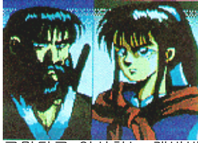
고맙다고 인사하는 개방방주