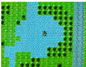
호수 아래의 비밀 통로

4층에서 보물 상자가 있는 방으로 내려가기 위해 사다리를 내려올 때 건달파왕이 나타나 공격을 한다. 건달파왕의 공격을 물리치고 사다리를 타고 아래로 내려가 상자를 열면 금구슬이 나온다. 이것을 가지고 남궁세가를 빠져나온다. 다시 소주로 돌아가 잠긴 문 앞으로가서 남궁세가에서 얻은 영룡교약을 사용, 문을 열고 안으로 들어가면 낙범생이 기다리고 있다. 그와 이야기하면 마교가 연단실을 만들고 칠채미혼산을 조제하여 사람들을 해치려한다는 사실을 알려준다. 성 오른쪽 아래의 호수로 가서 오른쪽 가운데로 들어가면 호수 밑으로 들어가는 비밀 통로가 나온다. 지하로 내려가면 한 사람이 기다리고 있다. 그와 이야기하면 이곳에는 진이 설치되어 있으며, 음양의 변화에 의해 눈에 보이는 것과 같이 길을 걸을 수 없다고 알려준다.