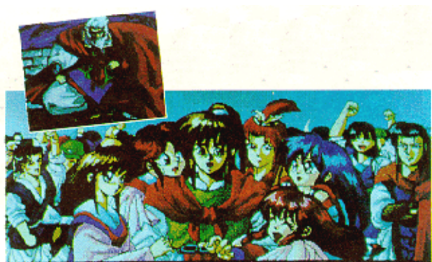
마을 사람들로부터 환영받는 주인공

벽을 따라 아래로 내려간 뒤 벽이 끝나는 곳에 다다르면 다시 오른쪽으로 한칸 이동해 아래로 내려간다. 그러면 물을 건너고 한 개의 상자를 볼 수 있다. 다시 오른쪽 끝까지 가면 사다리가 나온다. 사다리를 타고 지하 1층으로 올라간 다음 위쪽 사다리를 통해 1층으로 간다. 다시 위쪽 사다리를 통해 2층으로 올라간 다음 왼쪽으로 가서 맨 구석에 있는 사다리를 타고 3층으로 올라가면 가운데 검은 구멍이 있고 주위가 벽으로 둘러싸인 장소를 볼 수 있다. 문이 없는 것처럼 보이지만 가운데로 들어가면 지나갈 수 있다. 검은 구멍을 통해 아래로 떨어지면 상자가 한 개 나온다. 상자를 열어보면 삼탄비급이 나온다. 이것을 가진 다음 다시 같은 방법으로 물을 건너 맨 위층으로 올라가 오른쪽 아래 사다리를 타고 내려가면 지하 3층에서 마교교주를 만날 수 있다. 마교교주와 이야기하면 그는 자신이 이룩해 놓은 모든 것을 무너뜨린 데 대한 복수를 하겠다며 공격을 한다. 마교교주를 물리치고 나면 이후의 게임은 자동으로 진행된다. 마교교주는 죽으면서 기관을 작동, 마교기지가 무너지면서 물에 잠기게 된다. 취랑삼질식을 전개해 밖으로 빠져나가는 도중 물에 갇히면 용패가 나타나 길을 알려주고 밖에서 기다리고 있던 배를 타게 된다. 마교기지가 완전히 물속에 잠기는 것을 뒤로하고 장사 마을에 도착하면 모든 사람들이 열렬히 환영해 준다. 그리고 주인공은 지금까지 나왔던 다섯 명의 여자들에게 둘러싸인다.